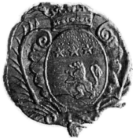
Fotografia amprentei sigilare a pecetii Ecaterinei Balș, baroană de Thorenc, 1822.

La photo de l'empreinte du cachet de Catherine Balsche, baronne de Thorenc, 1822.